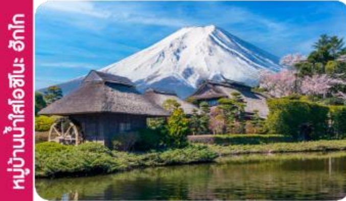
หมู่บ้านน้ำใสโอชิโนะ ฮักโก

เทศกาลชมดอกไม้ชิบะซากุระ (Shibazakura Festival) เป็นเทศกาลที่จัดขึ้นในช่วงฤดูใบไม้ผลิ เดือนเมษายนถึงพฤษภาคม โดยที่มีการจัดแสดงดอกชิบะซากุระ (หรือที่เรียกว่า "ดอกไม้มอส") ที่บานเต็มทุ่งหญ้า ดอกชิบะซากุระจะมีสีสันหลากหลาย เช่น สีชมพู ม่วง ขาว และแดง ซึ่งถือเป็นไฮไลท์ของในช่วงเทศกาลนี้ และจะได้เห็นทุ่งดอกไม้ที่กว้างขวางที่เรียงรายไปตามเนินเขาบรรยากาศที่สวยงามพร้อมกิจกรรมต่าง ๆ ให้ผู้เข้าชมได้เพลิดเพลิน เช่น การเดินเล่นในสวน ถ่ายรูป และการเพลิดเพลินกับวิวทิวทัศน์ที่สวยงามของภูเขาและธรรมชาติ