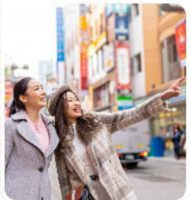
ช้อปปิ้งใจกลางกรุงโตเกียว